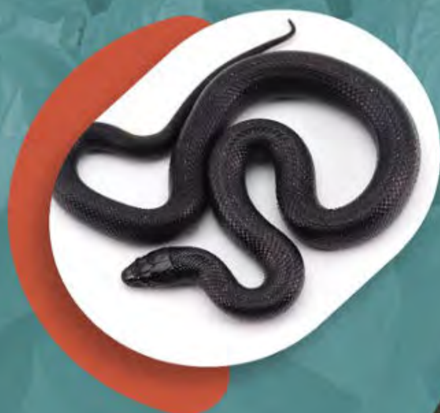
TILCUATE (Tipo de víbora negra)