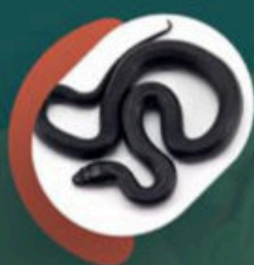
TILCUATE (Tipo de víbora negra)