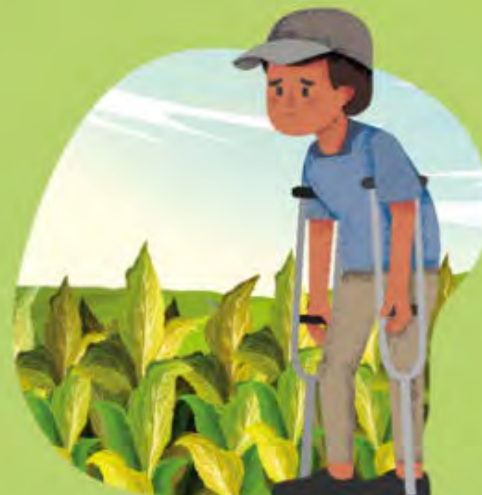
CAÍDAS O LESIONES QUE PUEDAN SER INCAPACITANTES