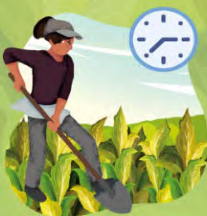
LARGAS HORAS DE TRABAJO