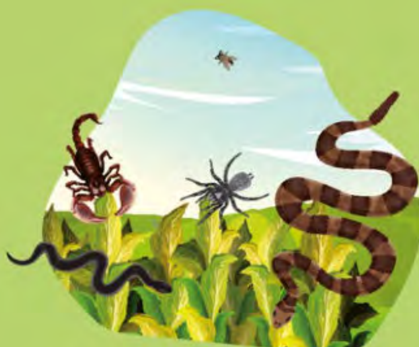
FAUNA NOCIVA (SERPIENTES, ARAÑAS U OTROS ANIMALES)