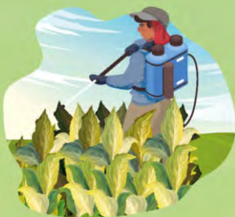
INTOXICACIÓN POR PESTICIDAS/ HERBICIDAS/ FUMIGANTES Y OTRAS SUSTANCIAS