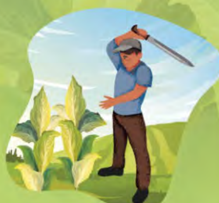
EQUIPO PELIGROSO Y OTRAS HERRAMIENTAS