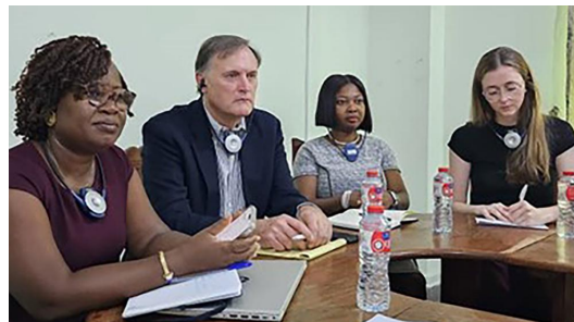
Session d'échange entre Verité et les membres du syndicat