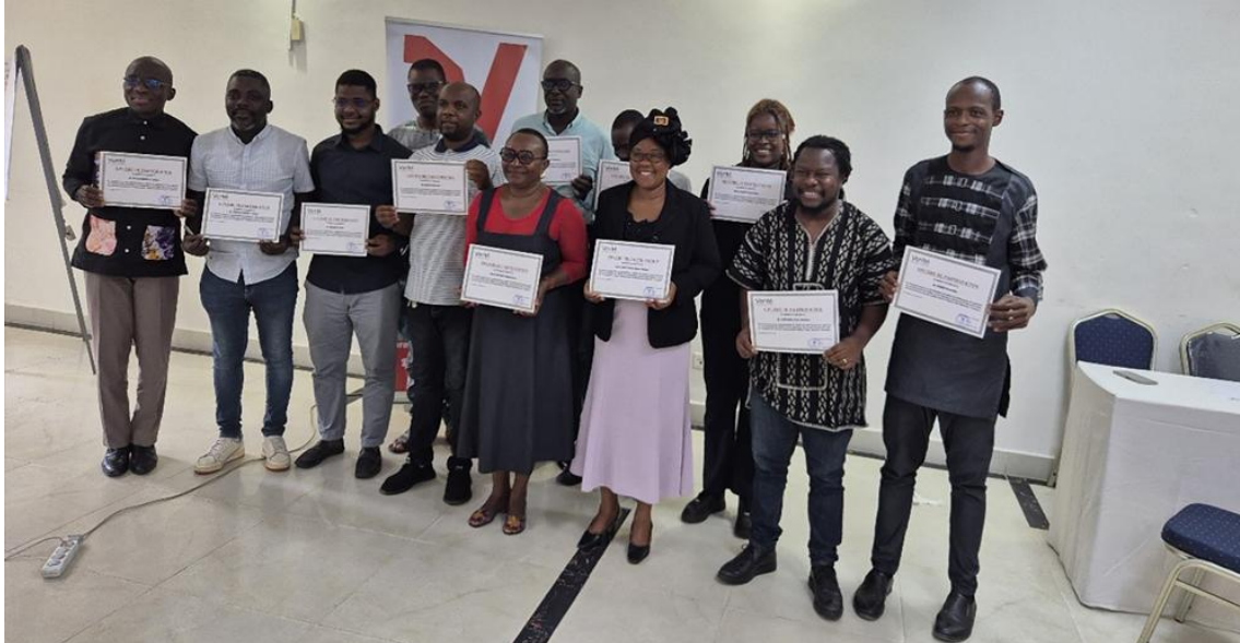
Photo de groupe des participants à la formation des professionnels des médias avec leurs certificats