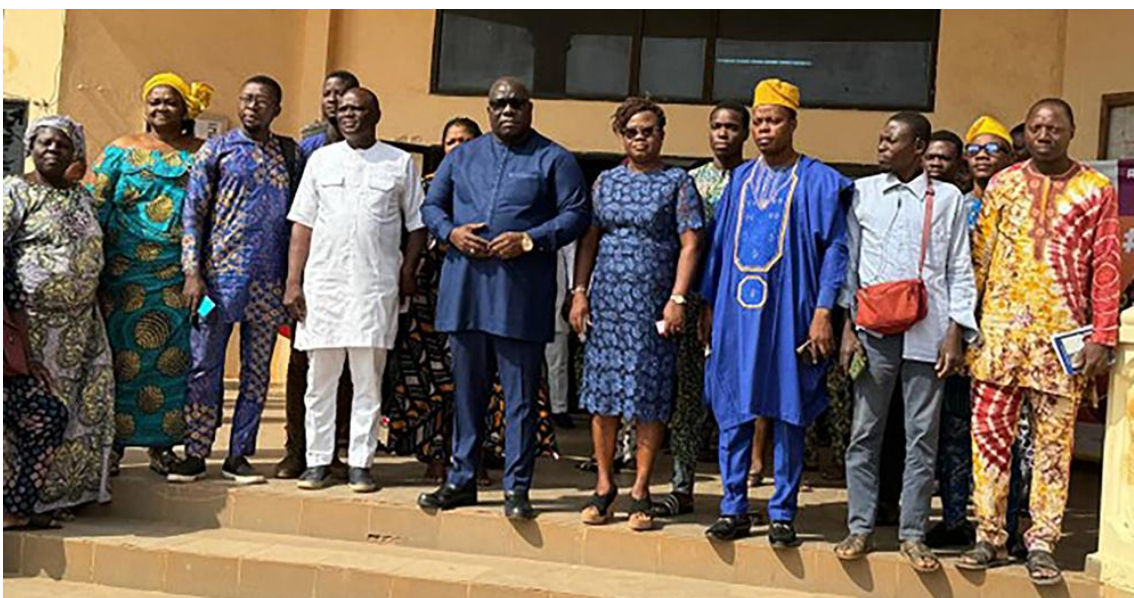
Photo de groupe des participants à la formation de sensibilisation des artisans d'Abomey-Calavi sur le travail forcé, le travail des enfants et les règles applicables au Bénin

Le vendredi 29 novembre 2024, une séance de sensibilisation a eu lieu à la Mairie d'Abomey-Calavi, réunissant 69 artisans locaux pour les sensibiliser sur le travail forcé, le travail des enfants, et les lois applicables au Bénin. L'événement a débuté par des discours du Président d'APDFT, du représentant du Directeur Départemental du Travail et de la Fonction Publique-Atlantique (DDTFP-Atlantique), et du Directeur National du FLIP Bénin. Le maire a officiellement ouvert la session, soulignant l'importance de ces questions pour le développement de la communauté. Les présentations de Verité, CNP-Bénin et DDTFP-Atlantique ont expliqué les dangers du travail forcé, de la traite des êtres humains et du travail des enfants. Les participants, dont beaucoup n'étaient pas au courant de ces questions, ont engagé des discussions et partagé leurs préoccupations. La session s'est achevée sur des résolutions axées sur la lutte contre le travail forcé et le travail des enfants, ainsi que sur des stratégies de sensibilisation et de vigilance au sein de la communauté.