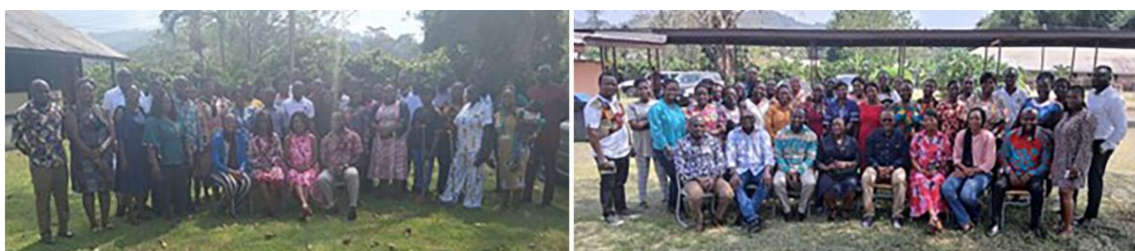
Gauche: Photo de groupe du premier groupe de participants Droite: Photo de groupe du deuxième groupe de participants

La Cocoa Health and Extension Division (CHED) du Ghana Cocoa Board (COCOBOD) soutient les cultivateurs de cacao par la lutte contre les maladies, la production de semences, l'amélioration des exploitations et l'éducation. En partenariat avec le FLIP, la CHED a organisé deux sessions de formation de deux jours pour son unité Gender Desk, du 11 au 15 novembre 2024, au Bunso Cocoa College, avec 74 participants issus des sept régions cacaovères. La formation a porté sur le travail forcé, le trafic d'êtres humains et les indicateurs de travail forcé de l'OIT, soulignant l'importance de l'expertise en la matière alors que les acteurs du gouvernement et du secteur privé collaborent pour sensibiliser et responsabiliser les parties prenantes tout au long de la chaîne de valeur du cacao.