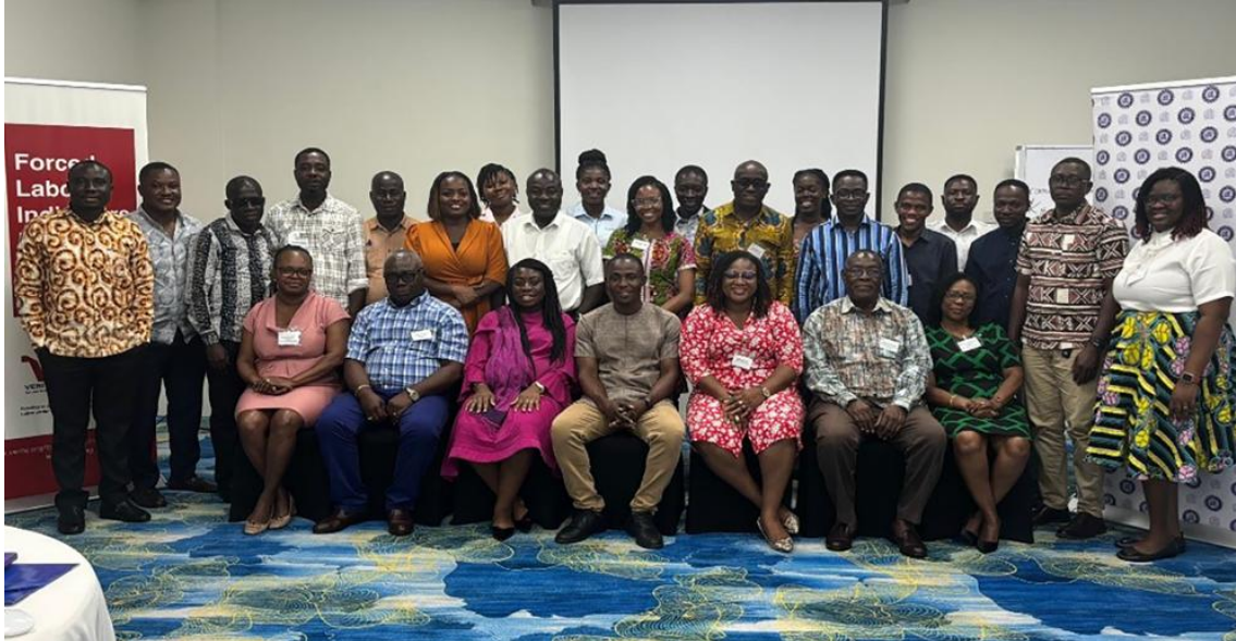
Les membres du GEA participent à la formation des formateurs