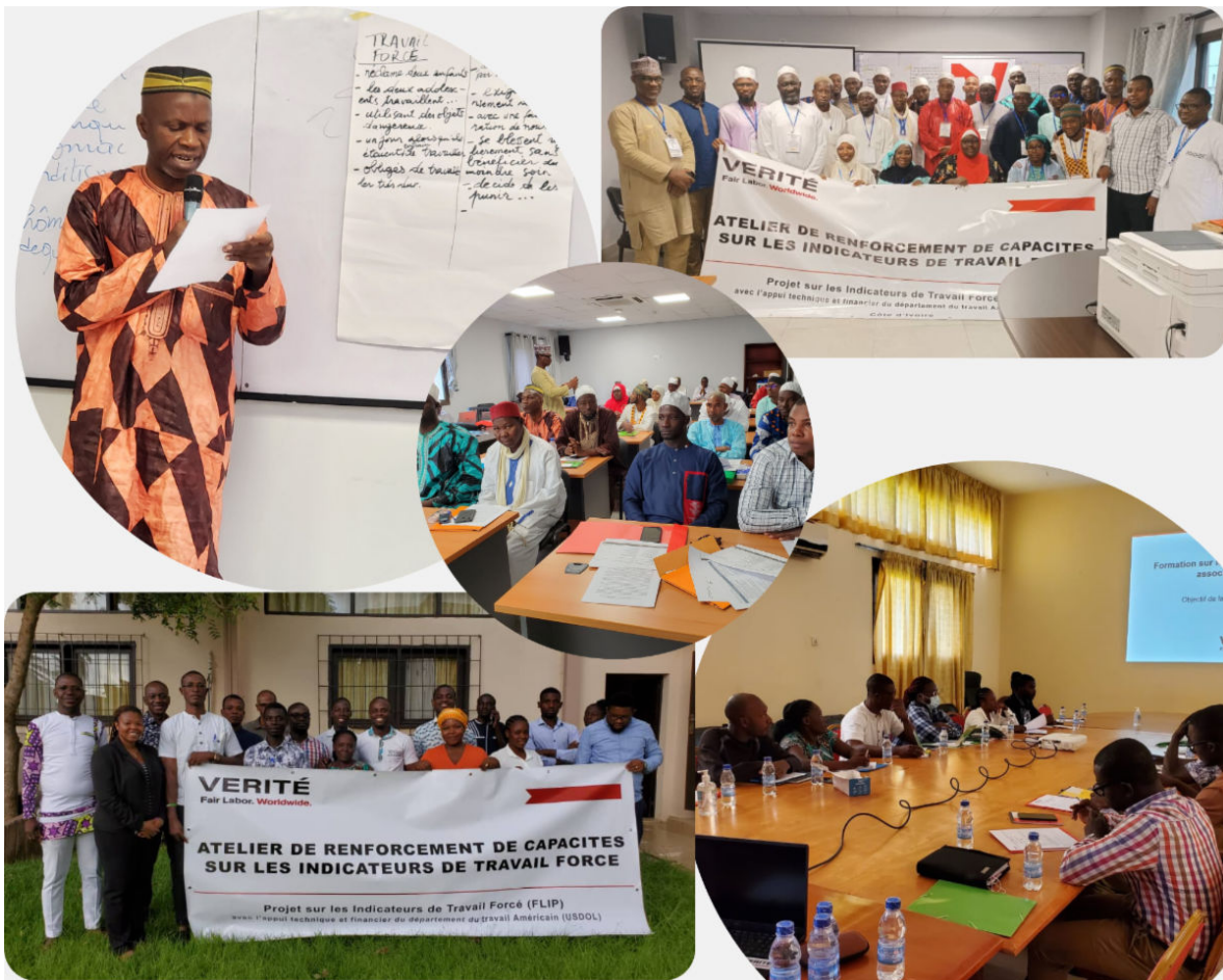
(En haut à gauche) Présentation d'un participant du Conseil supérieur des Imams (COSIM) ; photo de groupe de la formation pour le COSIM ; participants du COSIM écoutant une présentation ; photo de groupe de la formation pour les étudiants universitaires ; étudiants universitaires participant à la formation sur le travail forcé.

Le 7 novembre 2022, un groupe de journalistes connu sous le nom de Social Mobilization of Partners Against Child Labor (SOMOPAC) a participé à la formation sur le travail forcé organisée par le FLIP. Des journalistes de divers médias du Ghana ont participé à la formation et ont reçu des informations pour améliorer la précision des reportages et l'éducation du public sur les questions de travail forcé et l'approche de l'indicateur de l'Organisation internationale du travail (OIT). À la fin de la formation, les participants ont apprécié les connaissances acquises, car elles auront un impact sur leur travail, et ils attendaient avec impatience d'autres formations à l'avenir.