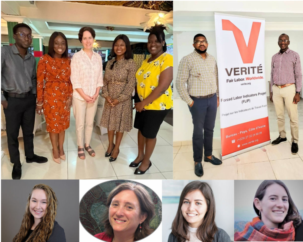
L'équipe du FLIP

De la part de l'équipe du FLIP, nous souhaitons à tous une nouvelle année saine, heureuse et paisible !