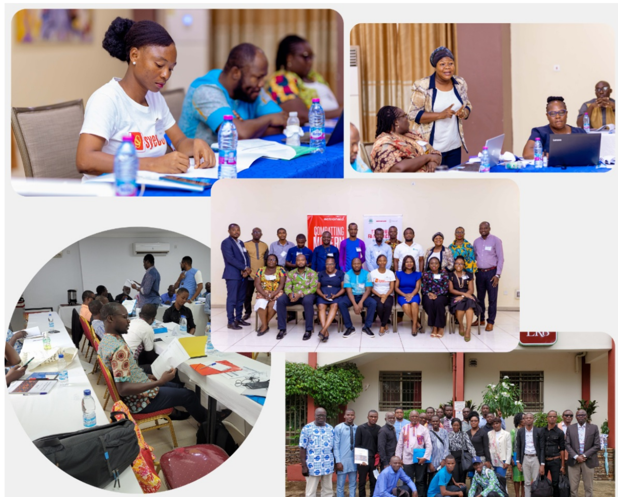
Sélection de photos des formations sur le travail forcé. Le coin supérieur gauche, le coin supérieur droit, le centre: Formation pour la Chambre d'Agribusiness Ghana. Le coin inférieur gauche, le coin inférieur droit: Formation pour les organisations non gouvernementales en Côte d'Ivoire

La formation a abordé les concepts de travail forcé et de traite des êtres humains, ainsi que les indicateurs du travail forcé de l'Organisation internationale du travail (OIT) et son approche. La formation a consisté en des sessions très interactives couplées à des jeux de rôle et des études de cas qui ont permis aux participants de partager leurs expériences dans le cadre de leur travail.