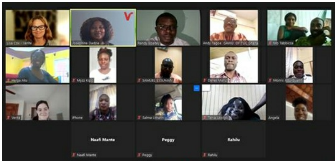
Les fonctionnaires du CHED participant à la FdF de Septembre, le personnel de Verité et le personnel du GAWU.

FLIP se réjouit de continuer à travailler avec le COCOBOD et les agents de vulgarisation du CHED sur la mise en œuvre des formations!